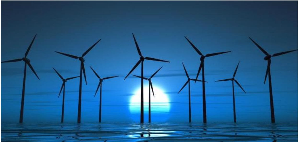
Windkraftanlagen in der Nordsee

der Ökostrom-Förderung. In ihrem jüngsten Aufsatz für das Fachmagazin „Resource and Energy Economics“ zitieren Mark Andor und Achim Voss Studien, denen zufolge die Zahl der Jahresstunden mit negativen Strompreisen von insgesamt 56 in diesem Jahr auf über 1000 im Jahr 2022 ansteigen könnte.